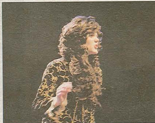
Molière, lui-même, était sur la scène de l'Espace Flandre.