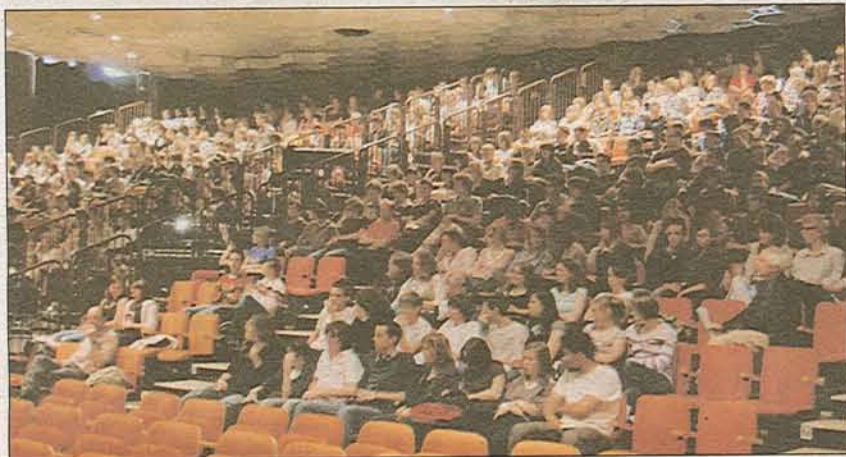
750 élèves ont participé à la séance scolaire du vendredi après-midi.